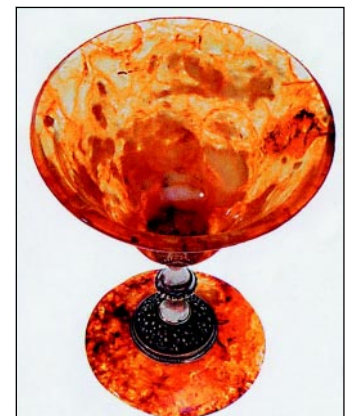
Fot. 2. Pucharek z bursztyńu prasowanego (rekonstruowanego), firmy Żemczuznaja Orchidieja.