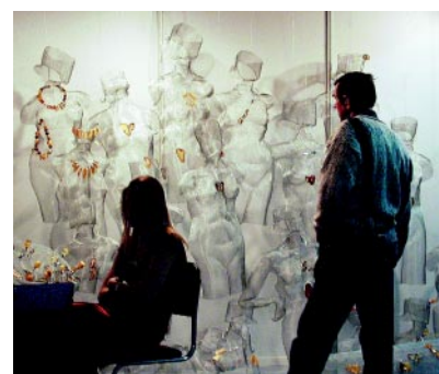
„Amberif 2002” odwiedziło ponad 6000 zwiedzających i fachowców.