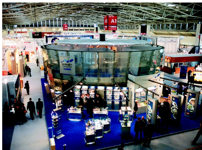
Fot. 2. Wspaniałe hale targowe pomieściły ponad 30 000 odwiedzających targi handlowców i jubilerów z całego świata.