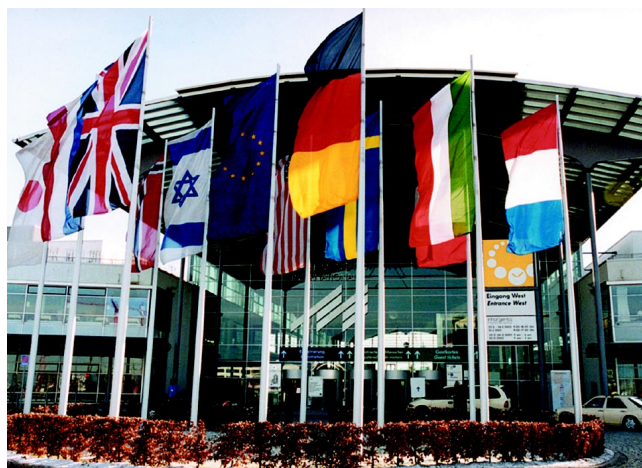
Fot. 1. Na targach monachijskich swoje wyroby prezentowali wystawcy z 55 państw.

Podczas targów odbywały się pokazy mody oraz rozwiązanie konkursu „Design meets fashion”. Promowano nową imprezę, mającą się odbyć w Szanghaju targi „Luxury China 2002”, przygotowywane przez targi monachijskie wspólnie z targami z Vicenzy. Odwiedzający mogli wziąć udział w wielu seminariach poświęconych tematom branżowym. W hali maszyn oraz wyposażenia pracowni i sklepów jubilerskich przeprowadzano pokazy najnowocześniejszych urzą-