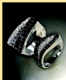
Na okładce: Pierścionek z kolekcji firmy KiM.

„Polski Jubiler” jest patronem prasowym Krajowej Izby Gospodarczej Jubilersko-Zegarmistrzowskiej.