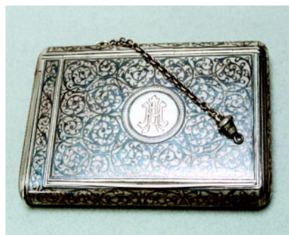
Papierośnica z pojemnikiem na zapalnik i z dewizką, srebro, próba 84, niello, długość 10,5 cm, waga 195 g, złotnik Gustaw Gustawowicz Klingiert, Moskwa, 1888 r.