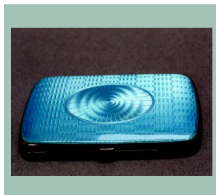
Papierośnica damska, srebro, próba 930, emalia, długość 9 cm, waga 101 g, złotnik MH, Norwegia, 1918 r.

Opracowanie i fotografie Ireneusz Wojczuk