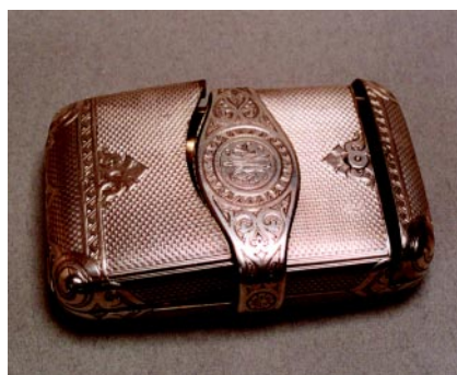
Papierośnica z pojemnikiem na zapalnik, srebro, próba 84, długość 12,1 cm, waga 210 g, złotnik Moisiej Iwanow, Petersburg, 1874 r.