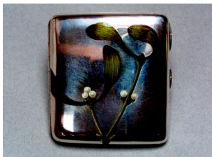
Papierośnica, srebro, próba 1, emalia, długość 8,3 cm, waga 167 g, złotnik G.A.S., Wiedeń, ok. 1900 r.