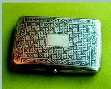
Podróźne pudełko na cygara, srebro, próba 84, niello, długość 13 cm, waga 182 g, złotnik Nikołaj Pawłowicz Pawłow, Moskwa, 1896 r. Pęknięcie blachy na zaokrąglonej krawędzi wieczka, przetarcia niella.