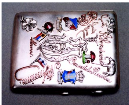
Papierośnica prezentowa, zapewne ślubna, srebro, próba 84, złoto, emalia, długość 11,7 cm, waga 261 g, Spółka Akcyjna Arteli Złotników Moskiewskich, Moskwa, 1908-1917 r.