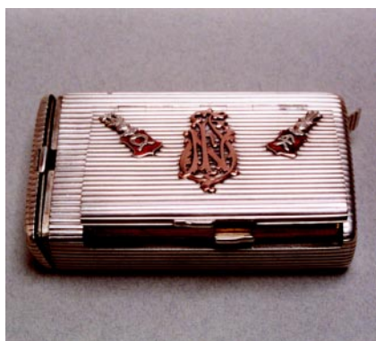
Papierośnica z pojemnikiem na zapalnik, zapalniczką i skrytką na fotografię, srebro, próba 84, złoto, emalia, długość ok. 10 cm, waga 276 g, złotnik Michaił Jakowlewicz Isakow, Petersburg, ok. 1890 r.